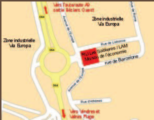
Plan d'accès du siège social à Vendres